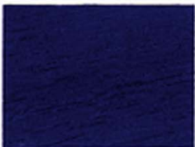
Dunkelblau Nr. 930-09