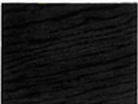
Schwarz Nr. 930-10