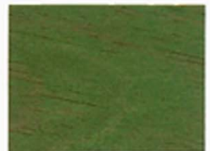
Grün Nr. 930-08