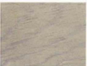
Grau Nr. 930-11