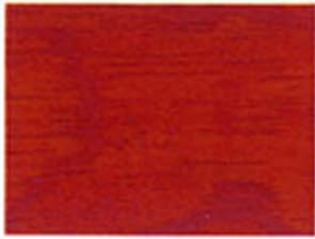
Dunkelrot Nr. 930-20