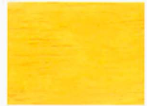
Ocker-Gelb Nr. 930-01