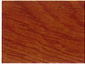
Braun Nr. 930-34