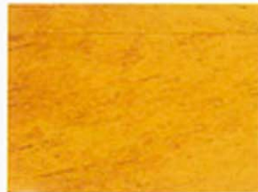
Hellbraun Nr. 930-32