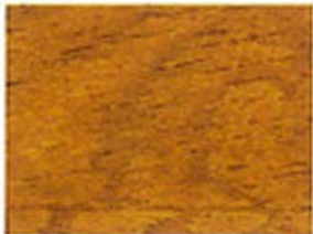
Umbra Nr. 930-33