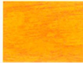
Orange Nr. 930-02