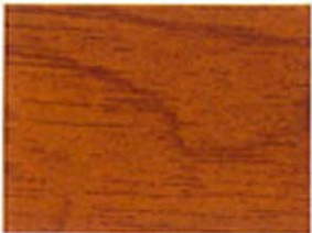
Ockerbraun Nr. 930-05