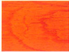
Orangerot Nr. 930-19