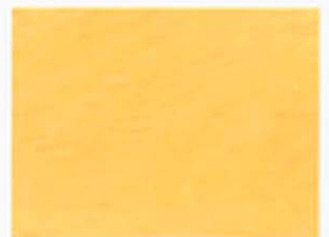
Pastellorange Nr. 930-18

Die Farbkarte ist im Druckverfahren hergestellt; gegenüber den Originalfarbtönen sind daher geringe Farbabweichungen möglich. Die Farbtöne wirken außerdem je nach Holzuntergrund, auf den sie aufgetragen werden, unterschiedlich und können durch den Einsatz natürlicher Rohstoffe leicht variieren. Aus diesen Gründen können wir keine Farbtonreklamationen anerkennen. Wir empfehlen, Probestflächen anzulegen, und achten Sie beim Kauf mehrerer Gebinde eines Farbtones darauf, daß sie die gleiche Chargennummer tragen. Zur Verarbeitung beachten Sie bitte unser Technisches Merkblatt Nr. 930.