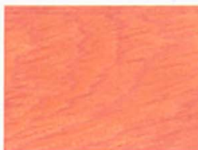
Altrosa Nr. 930-13