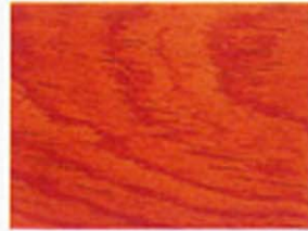
Rotbraun Nr. 930-04