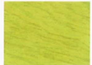
Grüngelb Nr. 930-07