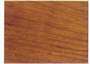
Mittelbraun Nr. 930-06