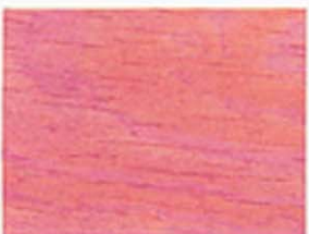
Pastellviolett Nr. 930-17