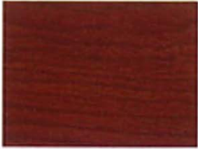
Dunkelbraun Nr. 930-22